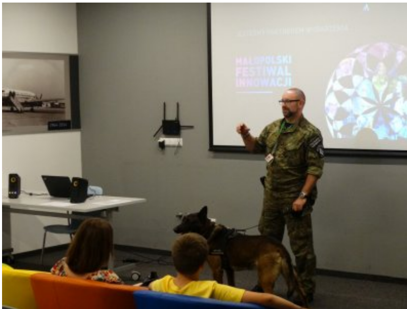
Edukacyjny tydzień w

W dniach 4 i 7 czerwca funkcjonariusz PSG w Krakowie-Balicach wraz z psem służbowym, uczestniczył w warsztatach „Innowacje VS natura, czyli zwierzęta w służbie”, odbywających się w ramach Małopolskiego Festiwalu Innowacji. Przewodnik psa służbowego przeprowadził zajęcia na temat psów pełniących służbę w krakowskim porcie lotniczym.