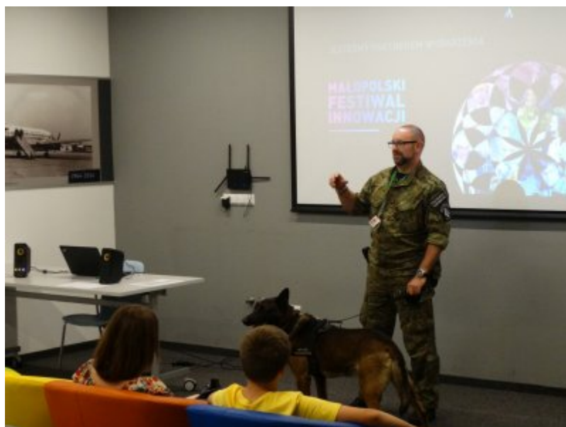
Edukacyjny tydzień w

W dniach 4 i 7 czerwca funkcjonariusz PSG w Krakowie-Balicach wraz z psem służbowym, uczestniczył w warsztatach „Innowacje VS natura, czyli zwierzęta w służbie”, odbywających się w ramach Małopolskiego Festiwalu Innowacji. Przewodnik psa służbowego przeprowadził zajęcia na temat psów pełniących służbę w krakowskim porcie lotniczym.