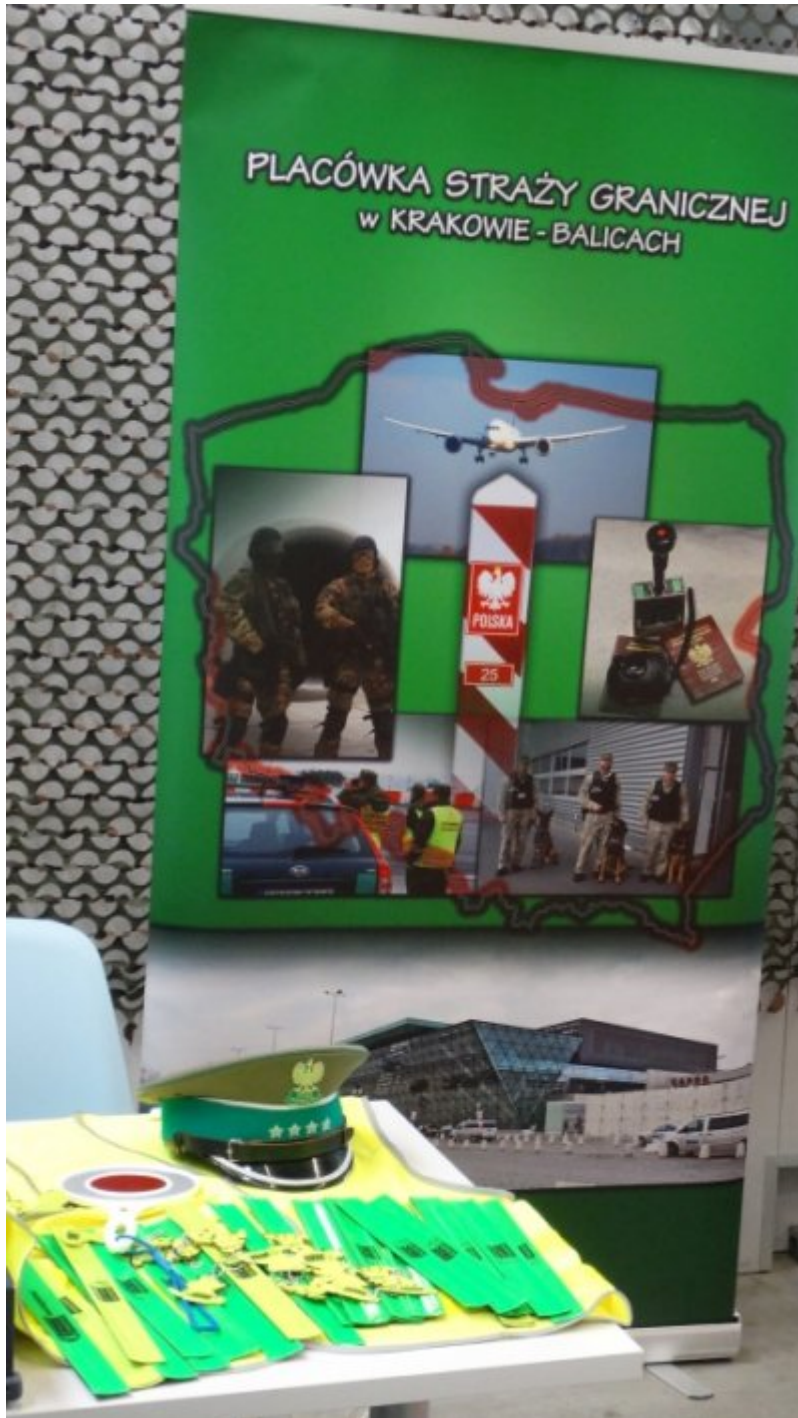
Edukacyjny tydzień w