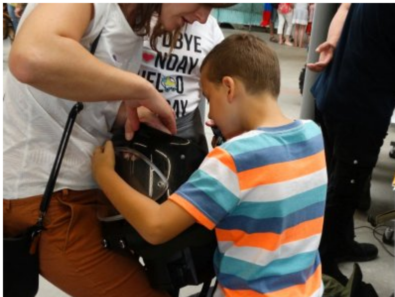
Edukacyjny tydzień w