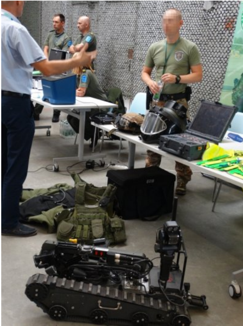
Edukacyjny tydzień w