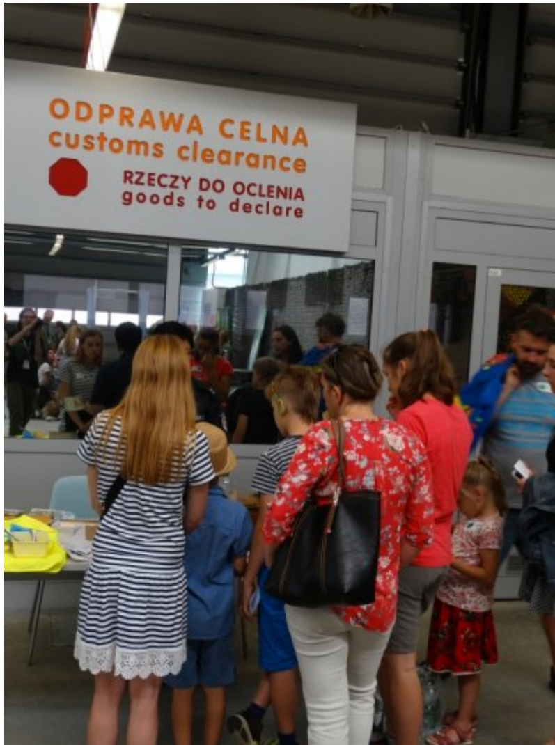
Edukacyjny tydzień w