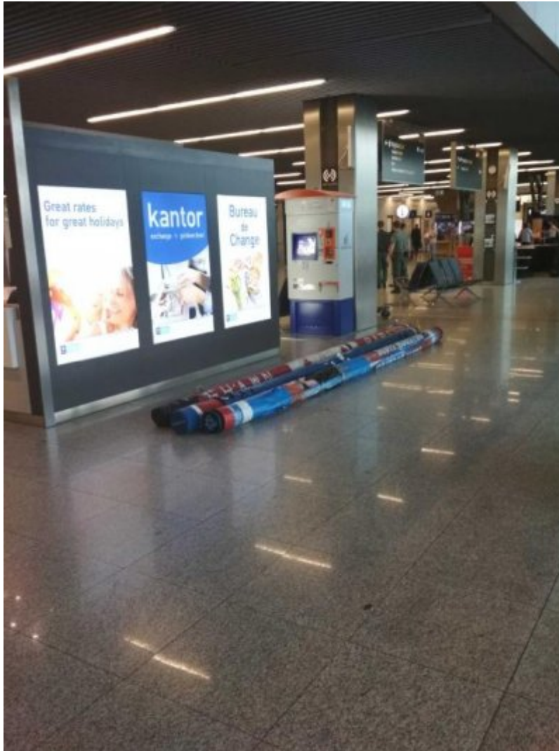
Tyczki pozostawione na