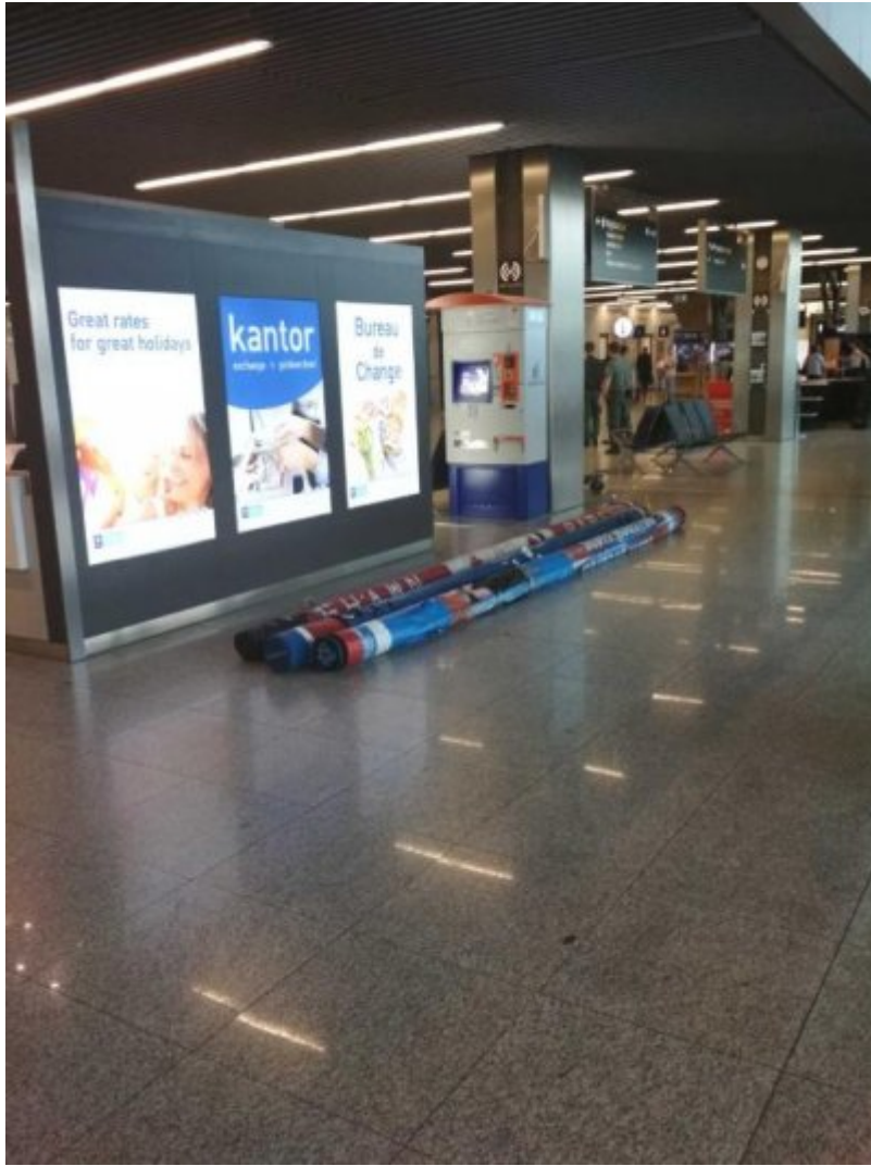
Tyczki pozostawione na lotnisku