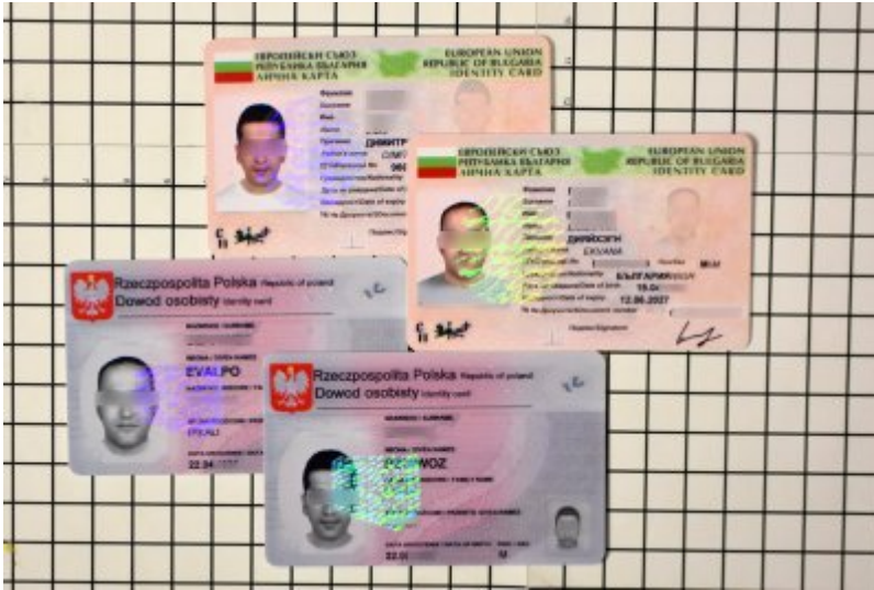
Fałszywe dokumenty ob.