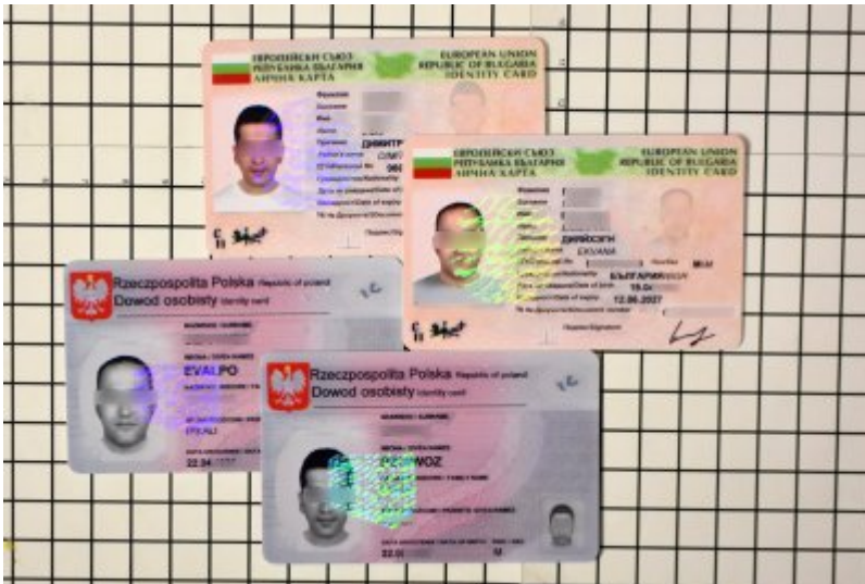
Fałszywe dokumenty ob.