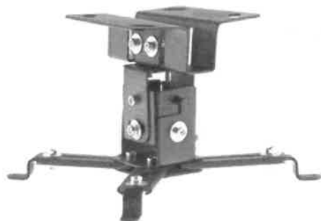
Zdjęcie przykładowe nr 2: Uchwyt do projektora