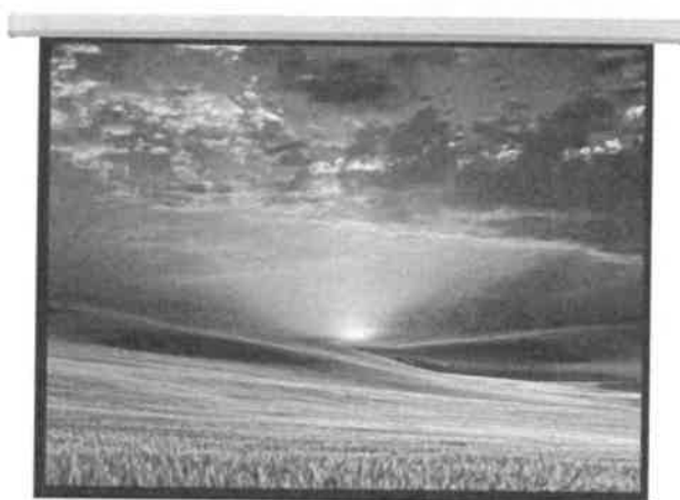
Zdjęcie przykładowe nr 3: Ekran do projektora