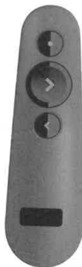
Zdjęcie przykładowe nr 8: Wskaźnik multimedialny