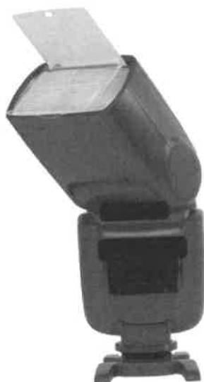
Zdjęcie przykładowe nr 6: Lampa błyskowa