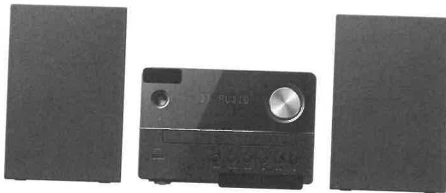
Zdjęcie przykładowe nr 7: Miniwieża