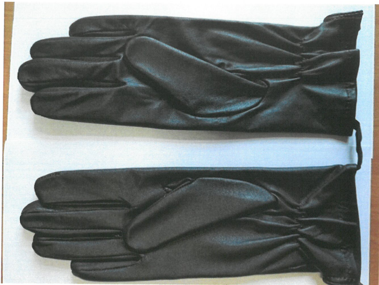
Zdjęcie 2. Strona chwytna rękawiczek