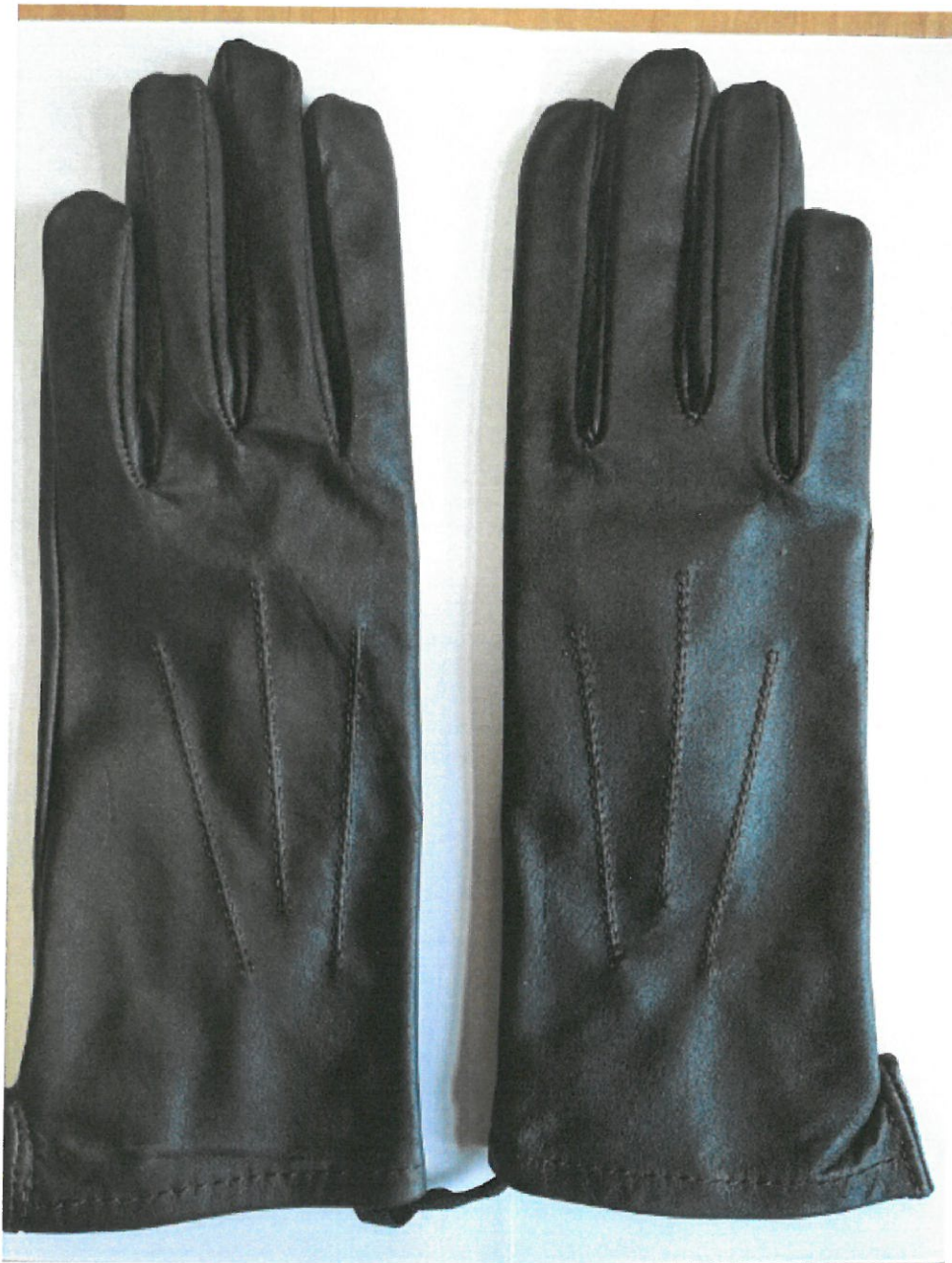
Zdjęcie 1. Strona wierzchnia rękawiczek