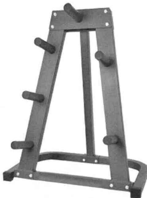
Zdjęcie przykładowe nr 8: Stojak na obciążenia olimpijskie