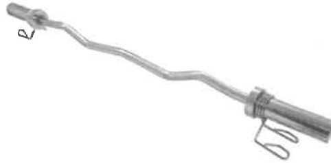
Zdjęcie przykładowe nr 4: Gryf olimpijski łamany z zaciskami