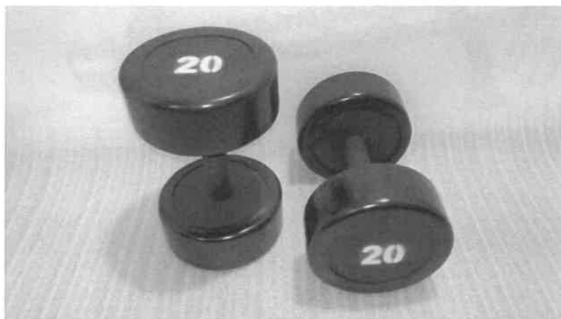
Zdjęcie przykładowe nr 1: Para hantli 20 kg