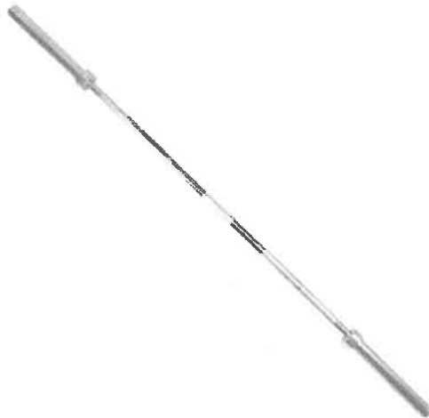
Zdjęcie przykładowe nr 6: Gryf olimpijski prosty 220 cm