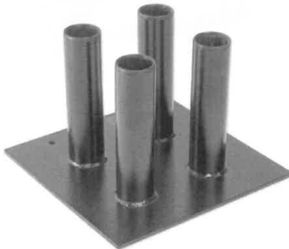
Zdjęcie przykładowe nr 7: Stojak na gryfy olimpijskie płaski na cztery gryfy