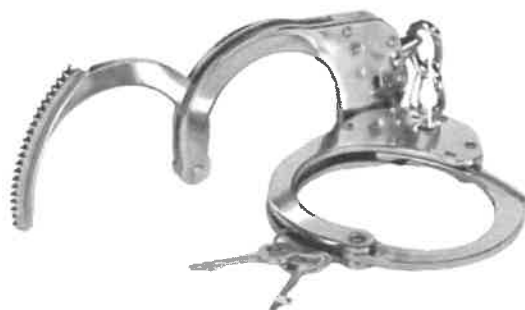
Zdjęcie przykładowe nr 4: Kajdanki szczękowe