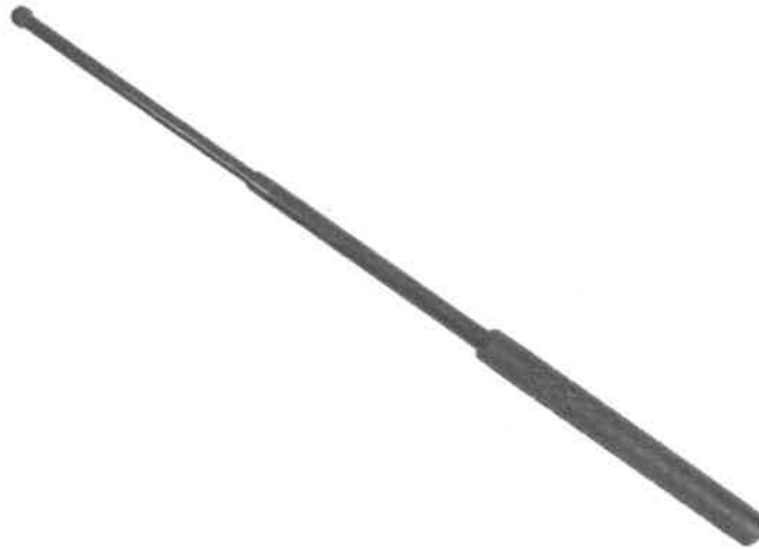
Zdjęcie przykładowe nr 3: Pałka teleskopowa