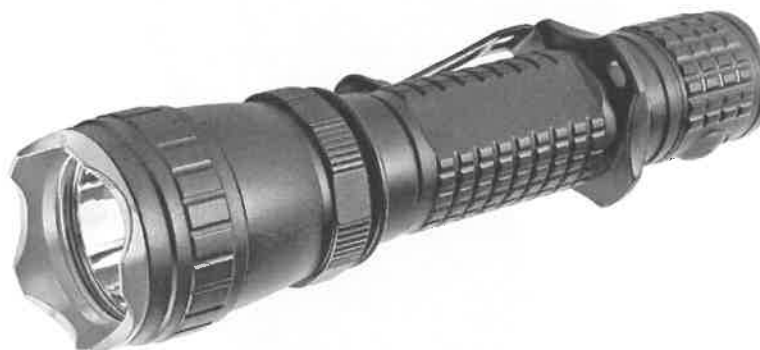
Zdjęcie przykładowe nr 1: Latarka ręczna