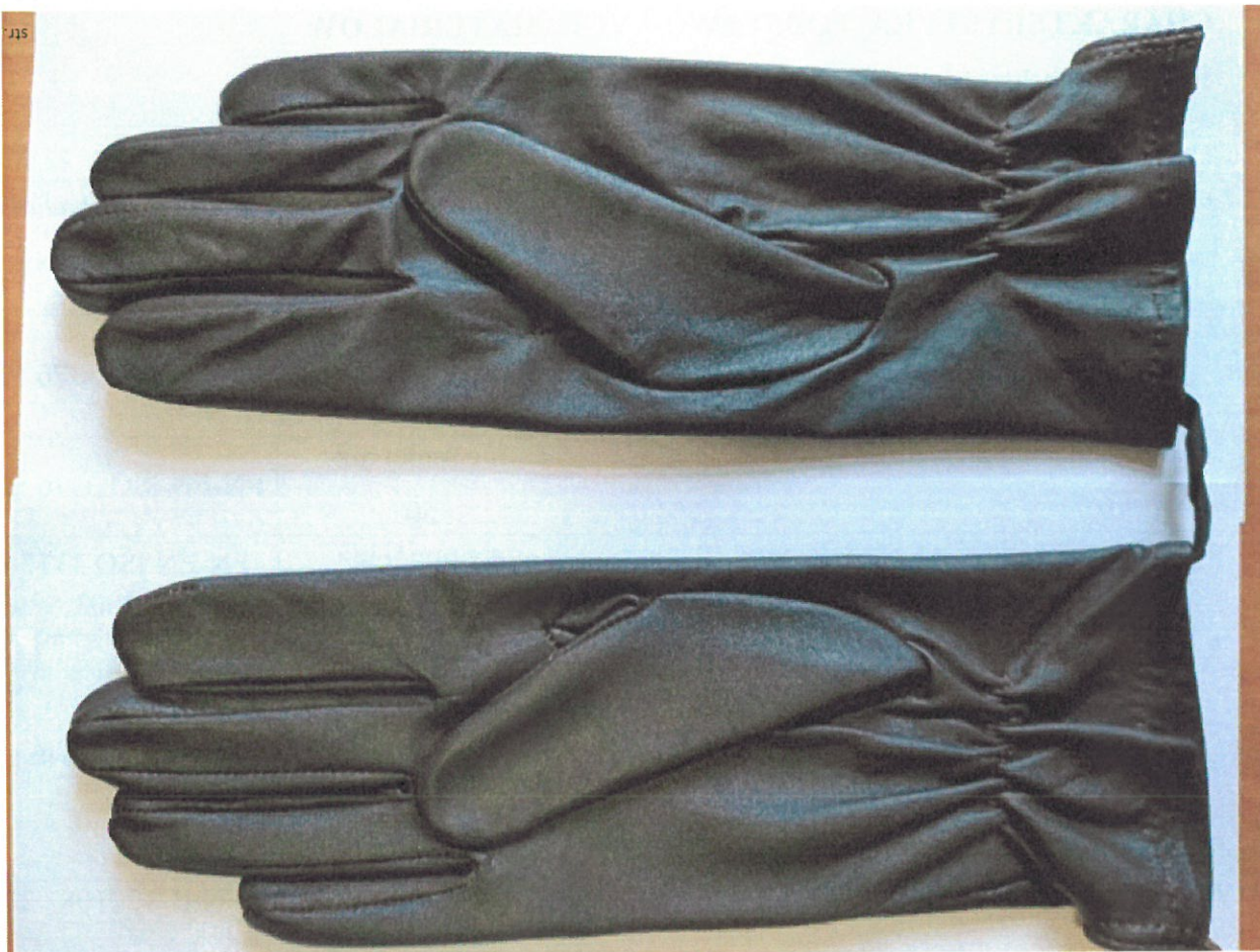
Zdjęcie 2 – Rękawiczki skórzane koloru ciemnobrązowego (strona wewnętrzna)