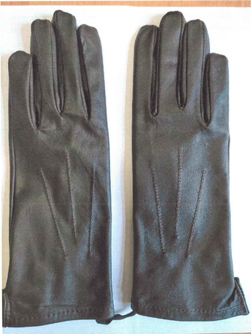
Zdjęcie 1. Rękawiczki skórzane koloru ciemnobrązowego (strona wierzchnia)