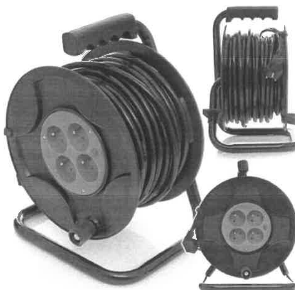
Zdjęcie przykładowe nr 3: Przedłużacz bębnowy