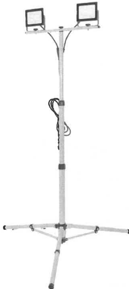
Zdjęcie przykładowe nr 2: Maszt oświetleniowy