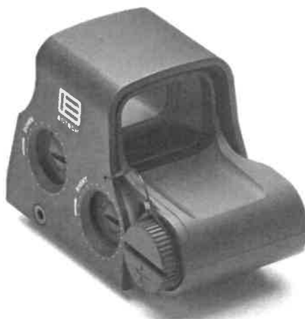
Zdjęcie nr 3 – celownik holograficzny EOTECH HWS EXPS-3