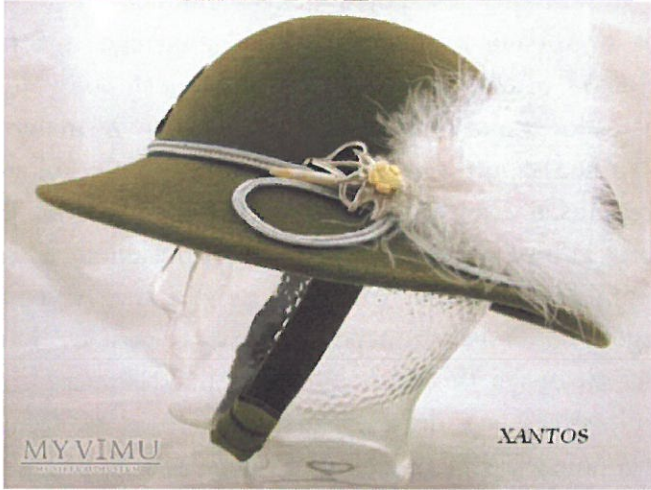
Zdjęcie. Kapelusz podhalański