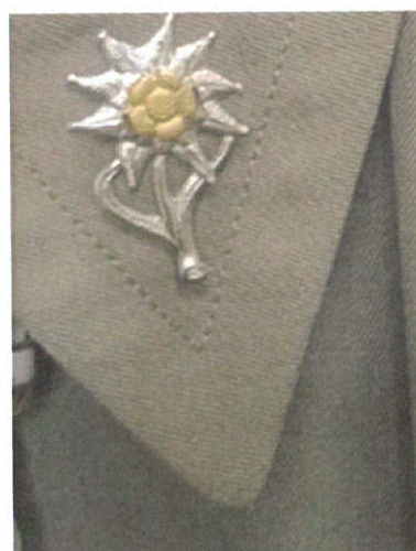
Rysunek 4. Szarotka na kołnierzu