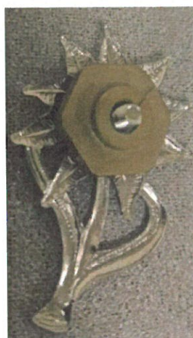
Rysunek 3. Szarotka - spód