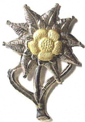
Rysunek 2. Szarotka