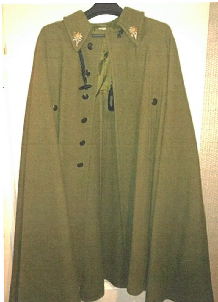
Rysunek 1. Peleryna podhalańska sukienna