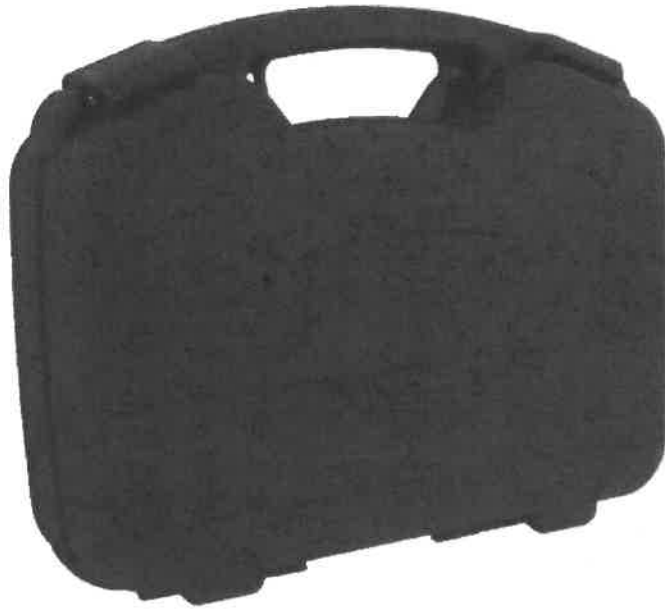
Zdjęcie przykładowe nr 2: Walizka na broń krótką i amunicję