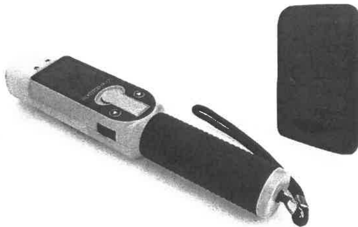
Zdjęcie przykładowe nr 9: Alkomat z drukarką termiczną