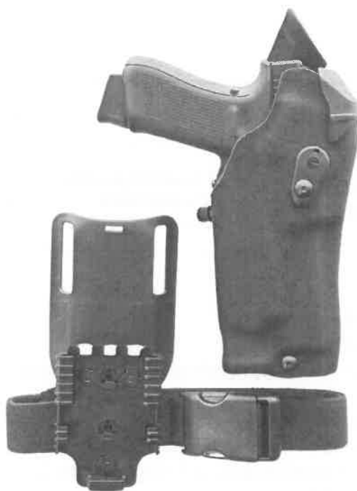
Zdjęcie przykładowe nr 3: Kabura do Glocka