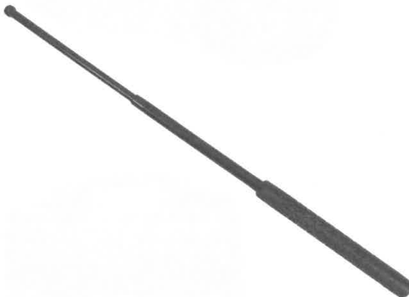
Zdjęcie przykładowe nr 1: Pałka teleskopowa