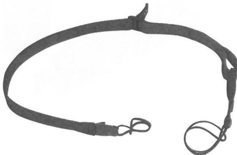
Zdjęcie przykładowe nr 8: Zawieszenie taktyczne do karabinu HK 416