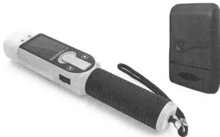
Zdjęcie przykładowe nr 9: Alkomat z drukarką termiczną