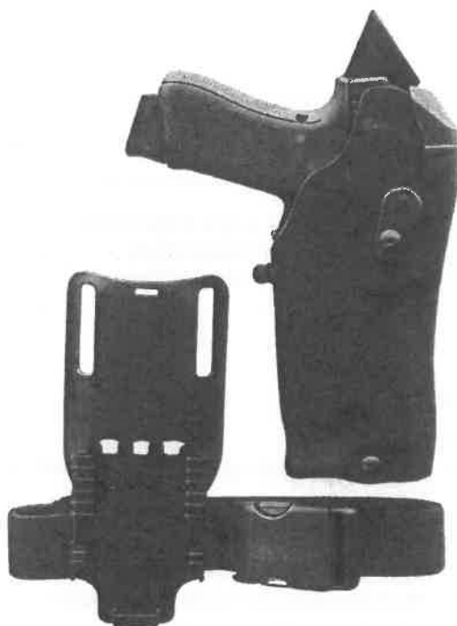
Zdjęcie przykładowe nr 3: Kabura do Glocka