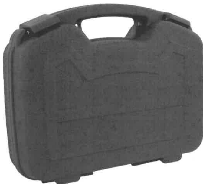
Zdjęcie przykładowe nr 2: Walizka na broń krótką i amunicję