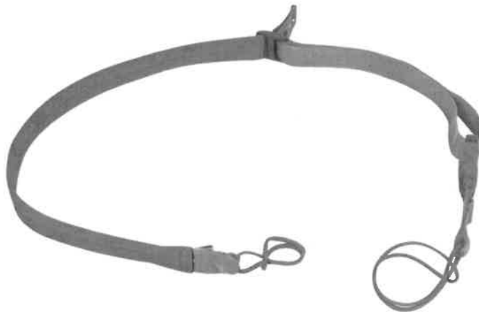
Zdjęcie przykładowe nr 3: Zawieszenie taktyczne do karabinu HK 416