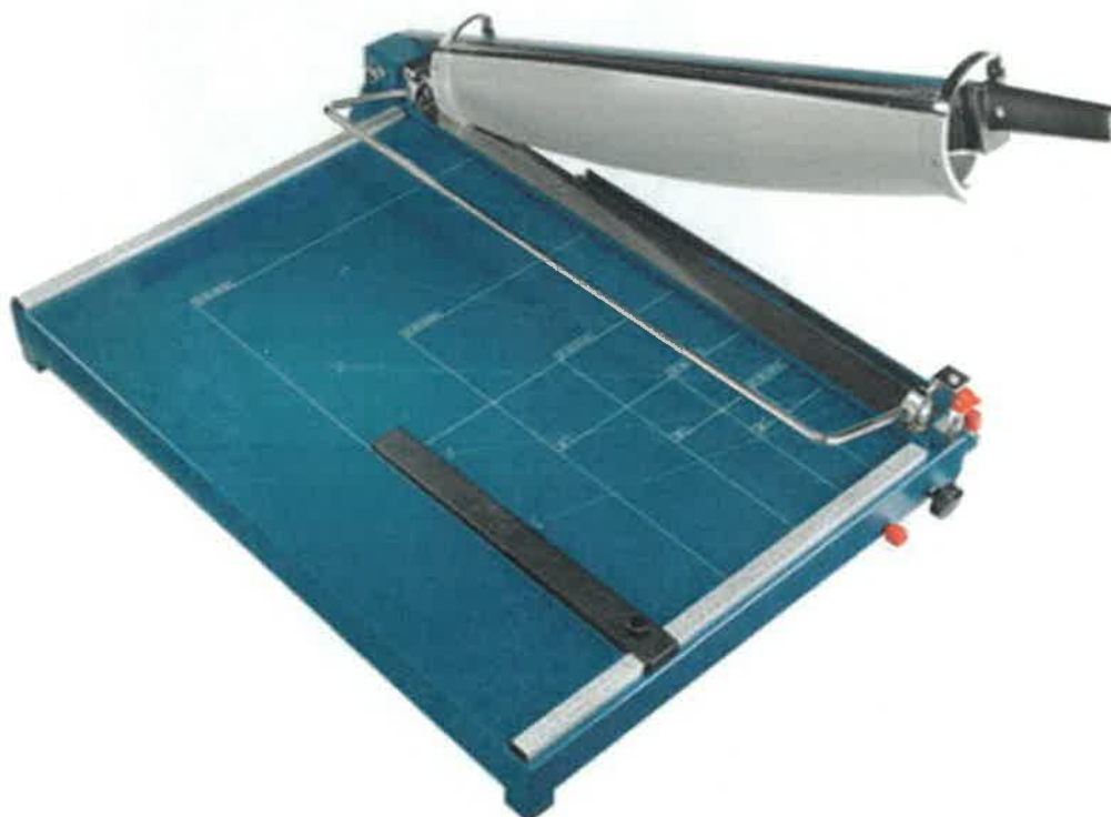
Zdjęcie przykładowe nr 3 – Gilotyna