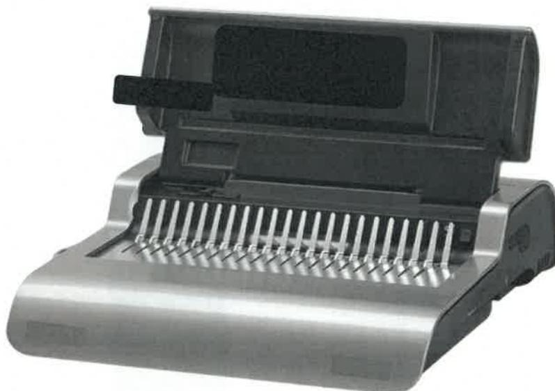
Zdjęcie przykładowe nr 2 – Bindownica