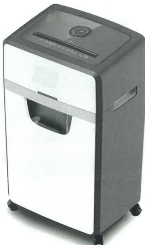
Zdjęcie przykładowe nr 1 – Niszczonek