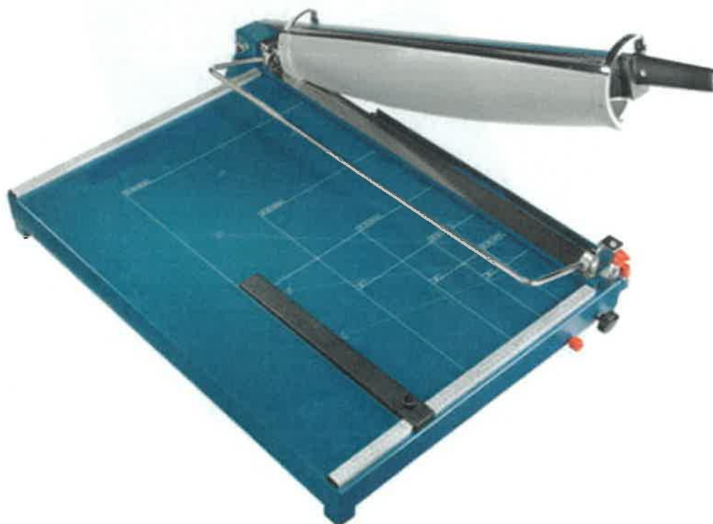
Zdjęcie przykładowe nr 3 – Gilotyna