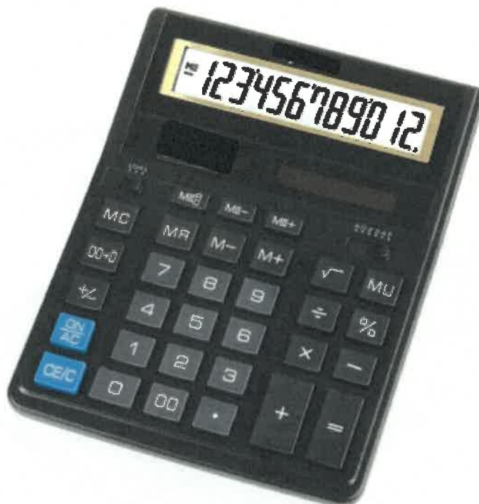
Zdjęcie przykładowe nr 4 – Kalkulator