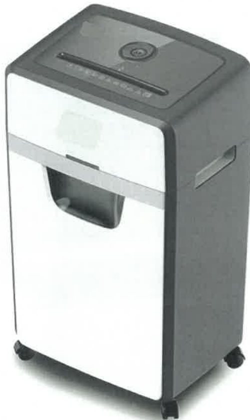
Zdjęcie przykładowe nr 1 – Niszcarka