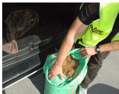
Nielegalne wyroby akcyzowe

15 kg krajanki tytoniowej bez polskich znaków akcyzy skarbowej ujawniono w samochodzie osobowym podczas kontroli drogowej realizowanej w powiecie limanowskim. Gdyby towar przewożony przez 55-latkę dostał się na rynek, Skarb Państwa straciłby blisko 12 tys. zł z tytułu uszczupień w podatku akcyzowym. Kierujący pojazdem obywatel Polski odpowie za naruszenie art. 65 § 1 kodeksu karnego skarbowego.