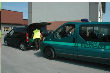
Nielegalne wyroby akcyzowe