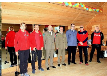
Rajd górski służb MSWiA - MURZASICHLE 2018