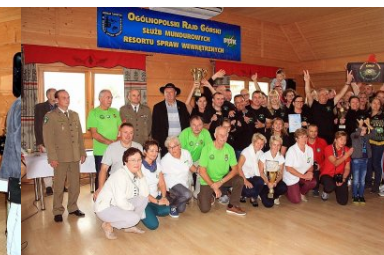
Rajd górski służb MSWiA - MURZASICHLE 2018