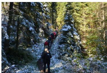
Rajd górski służb MSWiA - MURZASICHLE 2018