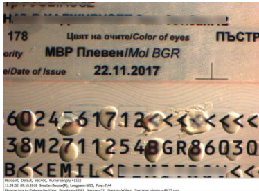
Fałszywe dokumenty ob. Iranu