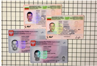
Fałszywe dokumenty ob. Iranu