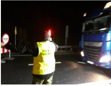
Funkcjonariusze PSG w Zakopanem podczas COP24