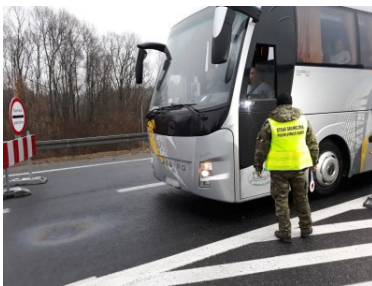
Funkcjonariusze PSG w Zakopanem podczas COP24