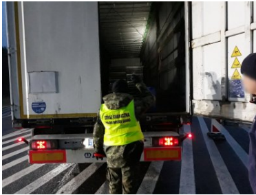
Funkcjonariusze PSG w Zakopanem podczas COP24