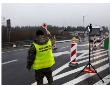
Funkcjonariusze PSG w

W skali całego kraju Straż Graniczna od 22 listopada do 16 grudnia skontrolowała 189 270 osób ze 187 krajów. Największą grupę skontrolowanych, bo aż 81 527 osób, stanowią Polacy. Kolejni to obywatele Ukrainy - 12 791, Niemiec - 9 853, Czech - 9568, Litwy - 8993, Włoch - 5756 i Szwecji - 4518. W wyniku tymczasowo przywróconej kontroli do Polski nie wpuszczono 37 osób. Zatrzymano w sumie 343 osoby, m.in. poszukiwane przez polski wymiar sprawiedliwości, unikające przesłuchania, czy zasądzonej kary pozbawienia wolności.