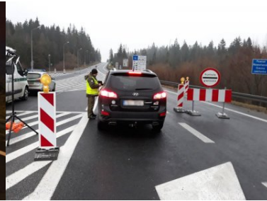
Funkcjonariusze PSG w Zakopanem podczas COP24