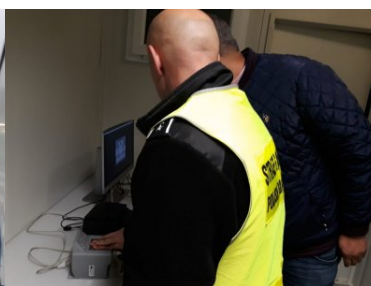
Funkcjonariusze PSG w