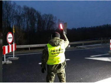
Funkcjonariusze PSG w Zakopanem podczas COP24