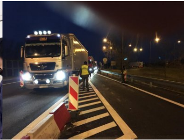
Funkcjonariusze PSG w Zakopanem podczas COP24