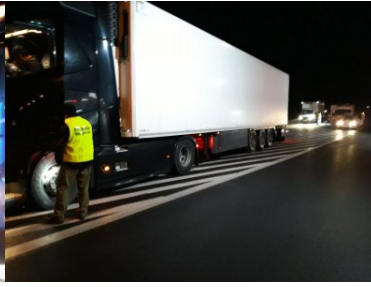
Funkcjonariusze PSG w Zakopanem podczas COP24