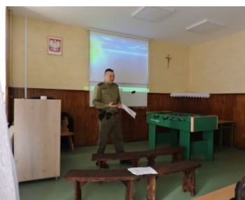
Funkcjonariusze SG podczas spotkania z dziećmi