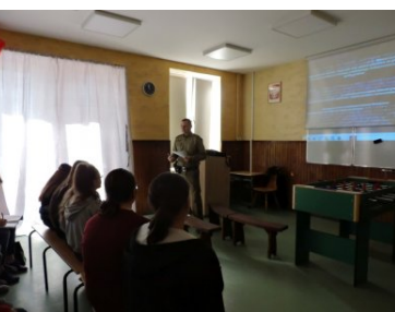
Funkcjonariusze SG podczas spotkania z dziećmi