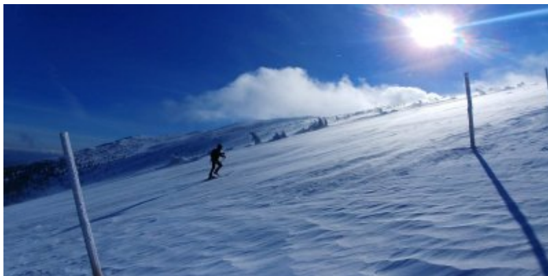
Szkolenie kondycyjno - tactyczne Funkcjonariuszy KaOSG