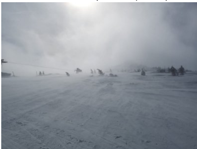
Szkolenie kondycyjno -