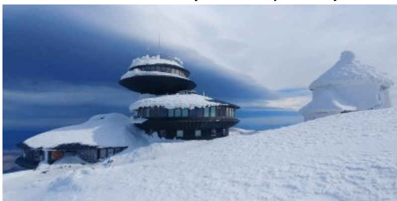
Szkolenie kondycyjno - tactyczne Funkcjonariuszy KaOSG