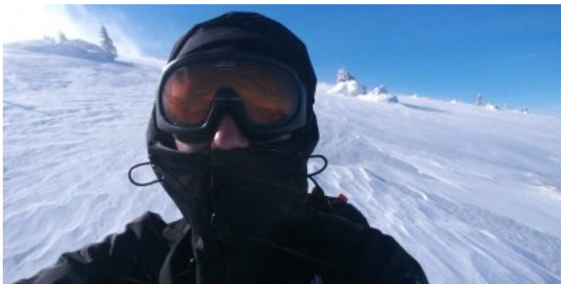
Szkolenie kondycyjno – taktyczne Funkcjonariuszy KaOSG

Tego typu szkolenia są niezbędne, aby szybko i skutecznie działać podczas realnych akcji w terenie.