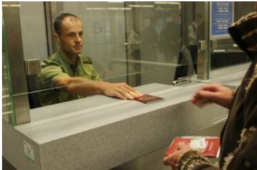
Bezpieczny długi weekend na lotnisku

Wszystkie poszukiwane osoby to Polacy w wieku od 25 do 41 lat. Dane osobowe 9 mężczyzn i jednej kobiety widniały w dostępnych bazach informatycznych, jako osób poszukiwanych przez polski wymiar sprawiedliwości. W 9 przypadkach osoby wracały z Wielkiej Brytanii. Jeden mężczyzna wpadł podczas kontroli na odlot samolotu do Zadaru (Chorwacja).