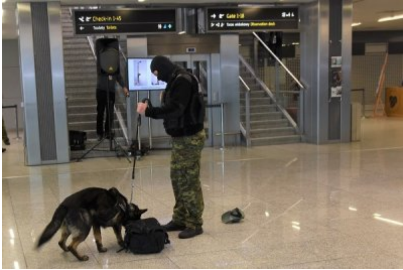
Pilnuj swoich bagaży!