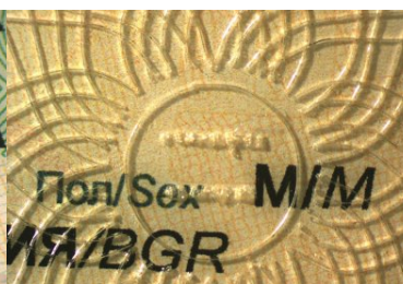
Gruzin z fałszywym bułgarskim dokumentem tożsamości