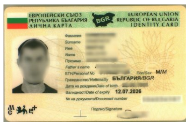
Gruzin z fałszywym bułgarskim dokumentem tożsamości

Dodatkowo, mężczyzna przesłuchany został w charakterze podejrzanego z powodu posłużenia się podrobionym bułgarskim dokumentem tożsamości w trakcie kontroli legalności pobytu, przyznał się do zarzucanych mu czynów oraz złożył wnioski o dobrowolne poddanie się karze w postaci kary 6 miesięcy pozbawienia wolności z warunkowym zawieszeniem jej wykonywania na 2 lata.