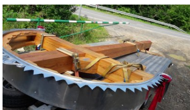
Miejsca pamięci odzyskują swój blask

Nekropolia w Małastowie - nad którą od 2016 roku patronat honorowy sprawuje Komendant KaOSG - doczekała się nowego drewnianego krzyża centralnego. Usytuowanie go na cmentarzu było utrudnione ze względu na bardzo skomplikowany dojazd oraz brak możliwości użycia ciężkiego sprzętu. Modrzewiowy krzyż o wymiarach 5,5 m x 2,2 m, wadze około 500 kg został ręcznie wniesiony i usytuowany w centralnej części miejsca spoczynku żołnierzy poległych w walkach podczas I wojny światowej.