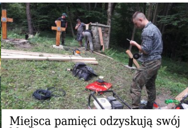
Miejsca pamięci odzyskują swój blask