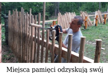
Miejsca pamięci odzyskują swój blask