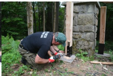
Miejsca pamięci odzyskują swój blask