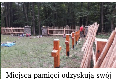
Miejsca pamięci odzyskują swój blask