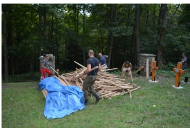
Miejsca pamięci odzyskują swój blask