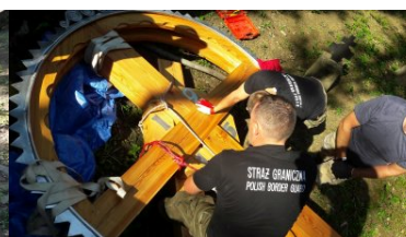
Miejsca pamięci odzyskują swój blask