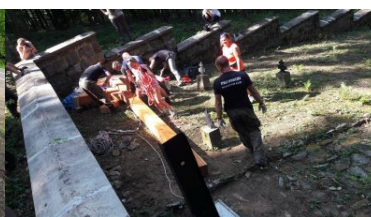
Miejsca pamięci odzyskują swój blask