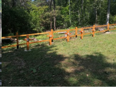
Miejsca pamięci odzyskują swój blask