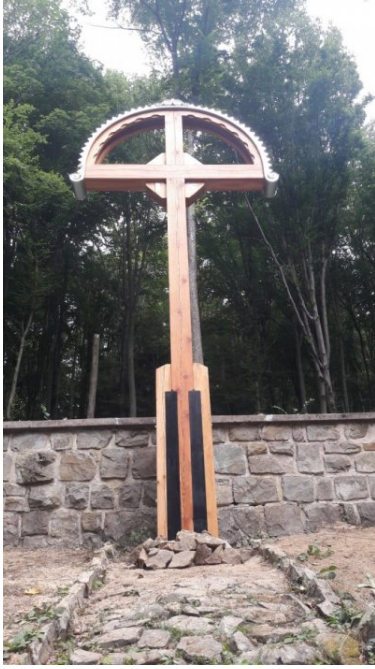
Miejsca pamięci odzyskują swój blask

Dużo wysiłku włożono również w budowę nowego ogrodzenia na cmentarzu wojennym nr 45 w Lipnej. Samo wniesienie materiału i narzędzi, do usytuowanego na leśnym wzgórzu miejsca pamięci, kosztowało sporo sił. Finalnie udało się zamontować główne filary ogrodzeniowe oraz wykonać część przęseł. Dodatkowo ogrodzenie zostało odpowiednio zabezpieczone przed szkodliwym działaniem warunków atmosferycznych.