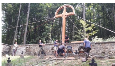
Miejsca pamięci odzyskują swój blask