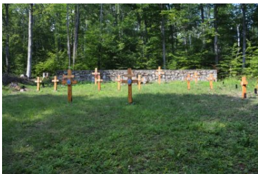
Miejsca pamięci odzyskują swój blask

Dużo wysiłku włożono również w budowę nowego ogrodzenia na cmentarzu wojennym nr 45 w Lipnej. Samo wniesienie materiału i narzędzi, do usytuowanego na leśnym wzgórzu miejsca pamięci, kosztowało sporo sił. Finalnie udało się zamontować główne filary ogrodzeniowe oraz wykonać część przęseł. Dodatkowo ogrodzenie zostało odpowiednio zabezpieczone przed szkodliwym działaniem warunków atmosferycznych.