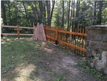
Miejsca pamięci odzyskują swój blask