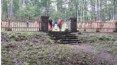
Miejsca pamięci odzyskują swój blask