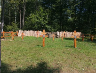
Miejsca pamięci odzyskują swój blask

Wszystkie przedsięwzięcia wykonywane na cmentarzach wojennych przez funkcjonariuszy Karpackiego Oddziału SG oraz policjantów z Klubu Górskiego Orły są zgodne z dokumentacją historyczną i prowadzone pod nadzorem konserwatora zabytków.