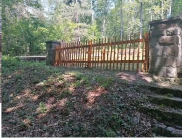
Miejsca pamięci odzyskują swój blask