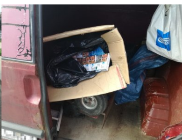
Emeryt przewoził nielegalne papierosy