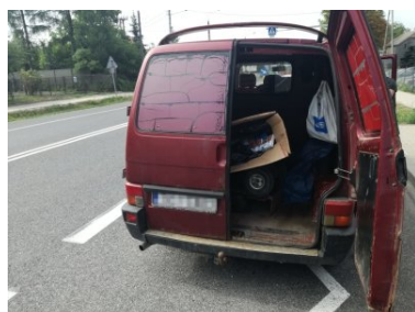
Emeryt przewoził nielegalne papierosy