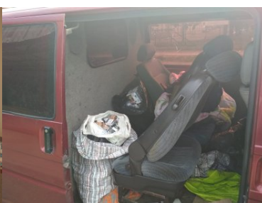
Emeryt przewoził nielegalne papierosy