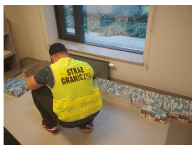
Emeryt przewoził nielegalne papierosy

Przypominamy, że nabywanie, przechowywanie, przewożenie, przesyłanie oraz przenoszenie wyrobów akcyzowych stanowiących przedmiot czynu zabronionego, podlega karze grzywny lub karze pozbawienia wolności do lat 3 (art. 65 §1 KKS).