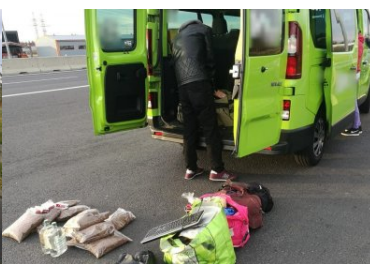
Chcieli zaoszczędzić...teraz grozi im grzywna