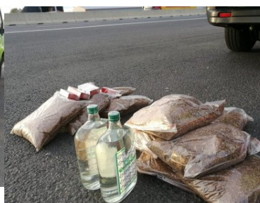
Chcieli zaoszczędzić...teraz grozi im grzywna