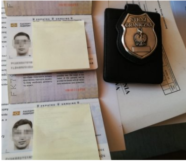
Z paszportem brata bliźniaka przez granicę