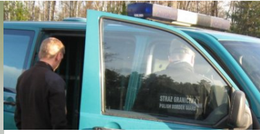
Z paszportem brata bliźniaka przez granicę