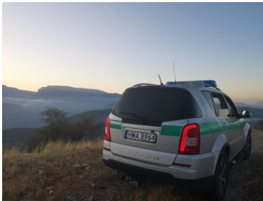
Ochroniamy nie tylko polskie granice