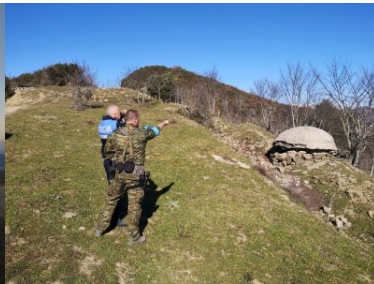
Ochroniamy nie tylko polskie granice