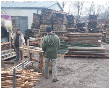
Pracowali nielegalnie - wrócą na Ukrainę

Ustalono również, że właściciel kontrolowanej firmy powierzał nielegalne wykonywanie pracy cudzoziemcom, tj. bez wymaganego przepisami zezwolenia na pracę oraz bez umowy o pracę, bądź umowy cywilnoprawnej zawartej w wymaganej formie. Naruszył tym samym art. 120 ust. 1 ustawy o promocji zatrudnienia i instytucjach rynku pracy. Wobec 40-letniego Polaka zostanie wszczęte postępowanie w sprawie o wykroczenie. Powierzanie nielegalnego wykonywania pracy cudzoziemcom zagrożone jest grzywną w wysokości nawet do 30 000 zł.