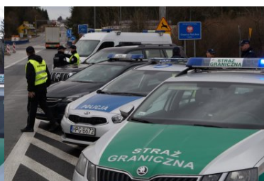
Wspólne bezpieczeństwo ponad wszystko