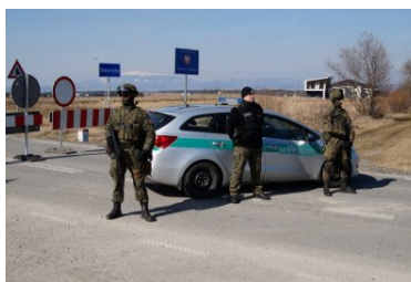
Wspólne bezpieczeństwo ponad wszystko

PAMIĘTAJ! My chronimy Ciebie, Ty ochroń Nas.