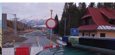
Wspólne bezpieczeństwo ponad wszystko