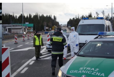
Wspólne bezpieczeństwo ponad wszystko