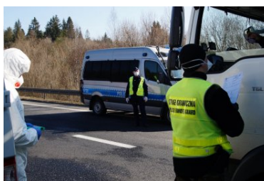
Wspólne bezpieczeństwo ponad wszystko