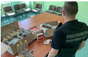
Handlowali nielegalnymi wyrobami akcyzowymi

Łączna wartość ujawnionego towaru wynosi blisko 17 tysięcy zł. Z kolei kwota uszczuplenia publiczno-prawnego to prawie 21 tysięcy złotych. Zabezpieczony towar został przekazany do magazynu depozytowego Placówki SG w Kielcach, celem dalszego procesowego wykorzystania.