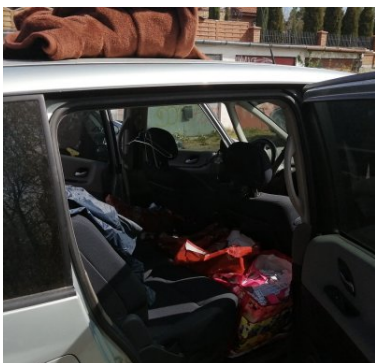
Handlowali nielegalnymi wyrobami akcyzowymi