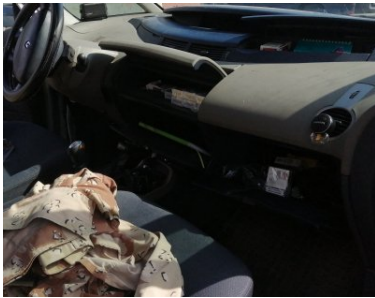
Handlowali nielegalnymi wyrobami akcyzowymi