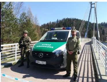
Funkcjonariusze KaOSG ochraniają granicę polsko- słowacką