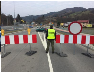
Funkcjonariusze KaOSG ochraniają granicę polsko- słowacką