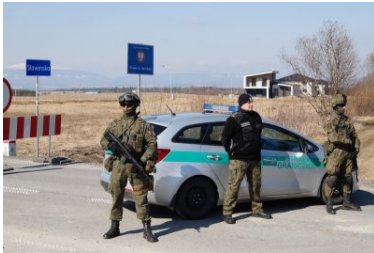
Funkcjonariusze KaOSG ochraniają granicę polsko- słowacką