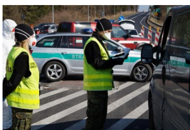
Punkt kontroli granicznej w Chyżnem

W związku z ograniczeniami w ruchu lotniczym, na lotnisku w Krakowie-Balicach odprawionych zostało tylko 25 samolotów, którymi podróżowało 340 osób. Ponadto przez przejście graniczne Muszyna-Plavec do Polski wjechały 254 pociągi towarowe, gdzie kontroli poddanych zostało 720 osób obsługujących składy. W trakcie tymczasowego przywrócenia kontroli granicznej największe wsparcie osobowe funkcjonariusze KaOSG uzyskali ze strony żołnierzy Wojska Polskiego. Ponadto stałe współdziałania prowadzone były z funkcjonariuszami Krajowej Administracji Skarbowej, Inspekcji Transportu Drogowego, Państwowej Straży Pożarnej, Straży Ochrony Kolei oraz Policji.