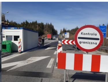
Punkt kontroli granicznej w Chyżnem