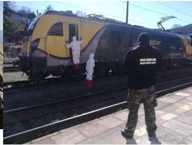
Funkcjonariusze KaOSG ochraniają granicę polsko- słowacką