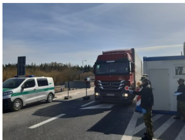
Punkt kontroli granicznej w Chyżnem

odcinek granicy polsko - słowackiej przekroczyło ponad 97 tys. osób. Blisko 1300 osób, które nie spełniały warunków wjazdu do Polski zostało zawróconych. Przez przejście graniczne w Chyżnem do Polski wjechało ponad 78,5 tys. pojazdów. Pojazdy ciężarowe stanowiły 61% ogółu, dostawcze o dmc do 3,5 t 29%, a osobowe 10%. Funkcjonariusze pełniący służbę na posterunkach blokujących, poinformowali i skierowali na dozwolone przejścia graniczne blisko 4,5 tys. osób chcących przekroczyć polsko-słowacką granicę.