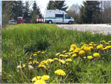
Funkcjonariusze KaOSG ochraniają granicę polsko- słowacką