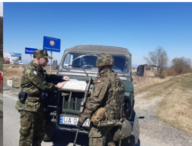
Funkcjonariusze KaOSG ochraniają granicę polsko- słowacką