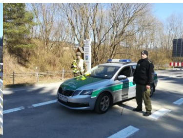
Funkcjonariusze KaOSG ochraniają granicę polsko- słowacką