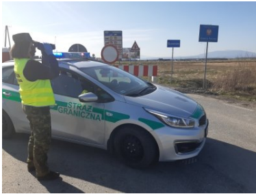
Funkcjonariusze KaOSG ochraniają granicę polsko- słowacką