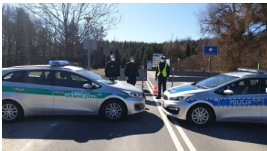
Funkcjonariusze KaOSG ochraniają granicę polsko- słowacką