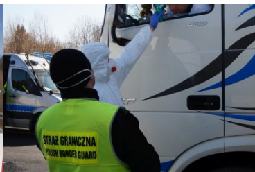
Punkt kontroli granicznej w Chyżnem