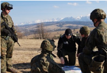
Funkcjonariusze KaOSG ochraniają granicę polsko- słowacką