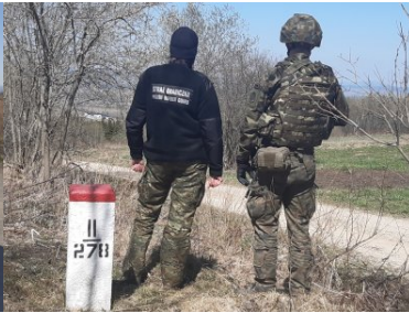
Funkcjonariusze KaOSG ochraniają granicę polsko- słowacką