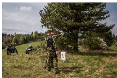
Dbają o bezpieczeństwo i porządek w górach

Strażnicy graniczni z Podhala wraz ze strażnikami PPN, aż 15-krotnie interweniowali wobec turystów poruszających się poza wyznaczonymi szlakami w obrębie parku narodowego. Tym razem byli wyjątkowo wyrozumiali - wobec wszystkich turystów, łamiących regulamin parku, zamiast mandatów zastosowali pouczenia.