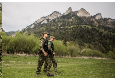
Dbają o bezpieczeństwo i porządek w górach

Natomiast podczas wspólnych działań w limanowskich kompleksach leśnych, szczególną uwagę objęte zostały tereny zagrożone nielegalnym wjazdem do lasu, kradzieżą drzewa oraz kłusownictwem. Tym razem obecność funkcjonariuszy odstraszyła miłośników off-roadu od wjazdu na tereny leśne oraz skutecznie zniechęciła do kradzieży drzewa oraz zastawiania wnyków na zwierzynę.