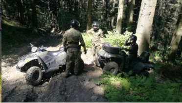
Dbają o bezpieczeństwo i porządek w górach