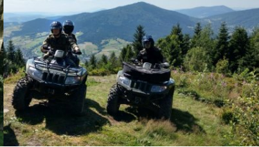
Dbają o bezpieczeństwo i porządek w górach