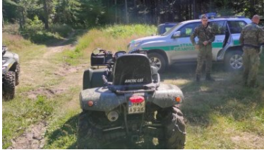
Dbają o bezpieczeństwo i porządek w górach