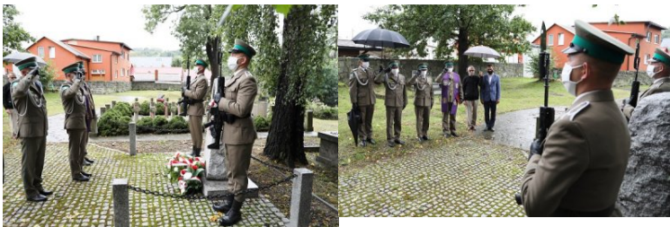
Uroczystości upamiętniające 81. rocznicę niemieckiej agresji na Polskę