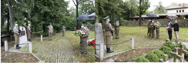
Uroczystości upamiętniające 81. rocznicę niemieckiej agresji na Polskę