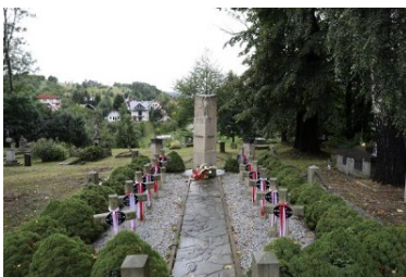
Uroczystości upamiętniające 81. rocznicę niemieckiej agresji na Polskę

Na nekropolii w Piwnicznej złożono również kwiaty pod pomnikiem poległych w II wojnie światowej.