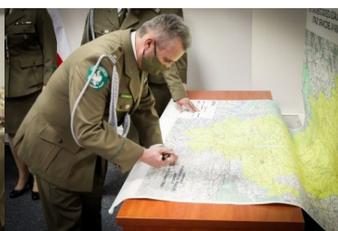
Powołanie na stanowisko Komendanta PSG w Krakowie