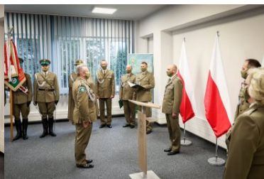
Powołanie na stanowisko Komendanta PSG w Krakowie