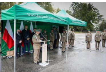
Uroczystości w Placówce SG w Kielcach