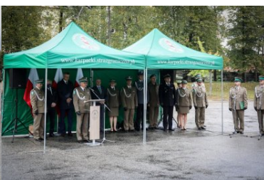
Uroczystości w Placówce SG w Kielcach