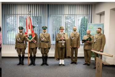
Powołanie na stanowisko Komendanta PSG w Krakowie