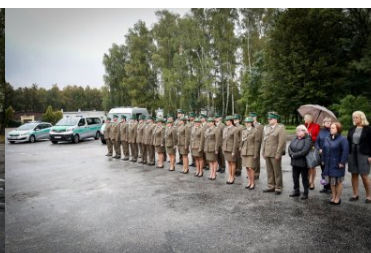
Uroczystości w Placówce SG w Kielcach