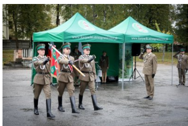
Uroczystości w Placówce SG w Kielcach

Komendant KaOSG wręczył powołanym funkcjonariuszom rozkazy personalne oraz pogratulował komendantom awansu.