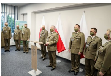
Powołanie na stanowisko Komendanta PSG w Krakowie