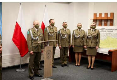
Powołanie na stanowisko Komendanta PSG w Krakowie