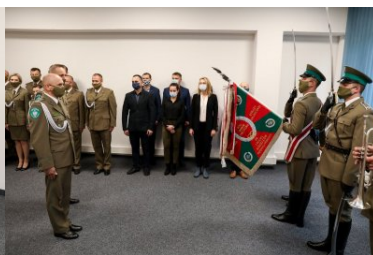
Powołanie na stanowisko Komendanta PSG w Krakowie