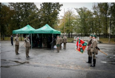
Uroczystości w Placówce SG w Kielcach