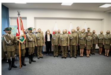
Powołanie na stanowisko