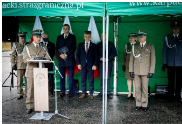
Uroczystości w Placówce SG w Kielcach