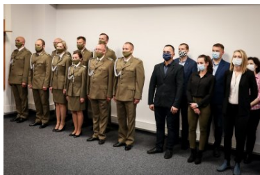
Powołanie na stanowisko Komendanta PSG w Krakowie