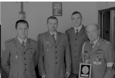
Ostatnie pożegnanie bohatera