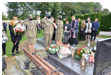
Ostatnie pożegnanie bohatera