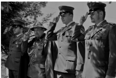
Ostatnie pożegnanie bohatera