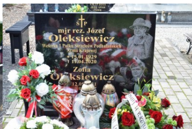
Ostatnie pożegnanie bohatera