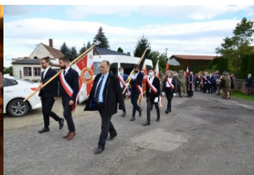
Ostatnie pożegnanie bohatera