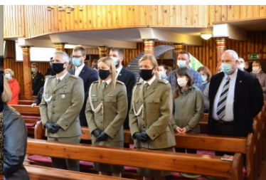
Ostatnie pożegnanie bohatera