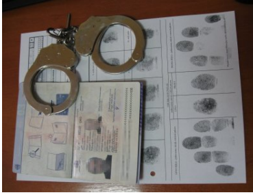
Kolejni cudzoziemcy zatrzymani przez PSG Kielce