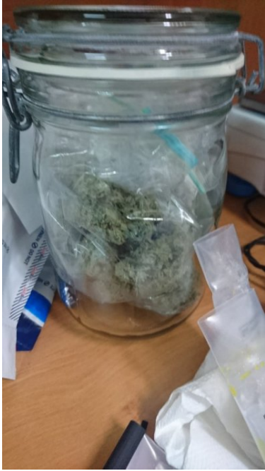
Akt oskarżenia wobec 10 osób - to wynik śledztwa PSG w Tarnowie