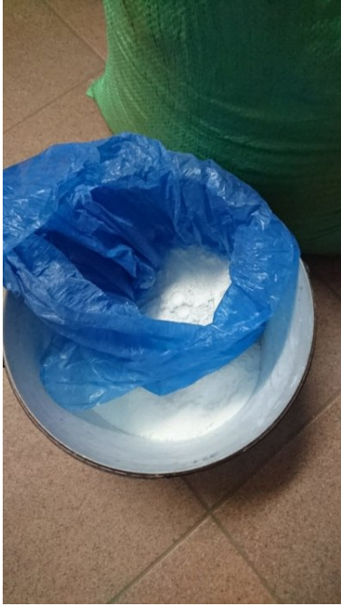
Akt oskarżenia wobec 10 osób - to wynik śledztwa PSG w Tarnowie