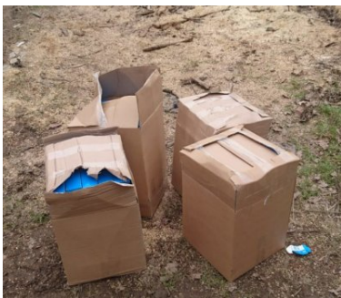
Akt oskarżenia wobec 10 osób – to wynik śledztwa PSG w Tarnowie

Dokonano zabezpieczenia majątkowego na mieniu podejrzanych na kwotę ok 75 tys. zł.