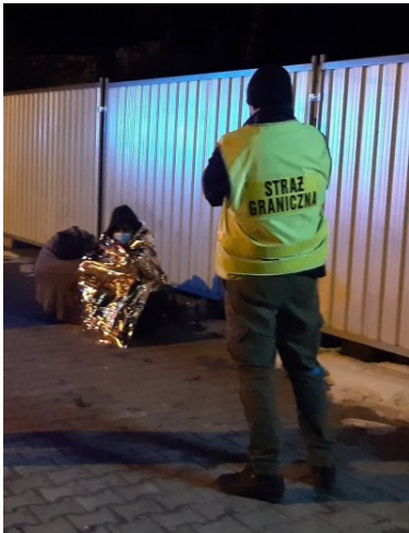
Dwaj nielegalni migranci zatrzymani w Chyżnem