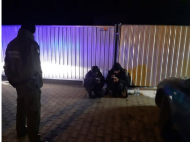
Dwaj nielegalni migranci zatrzymani w Chyżnem