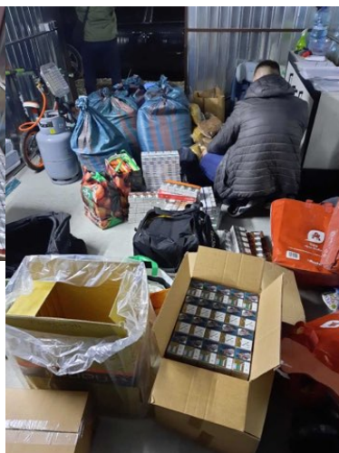
Garaż wypełniony kontrabandą