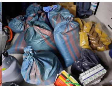
Garaż wypełniony kontrabandą