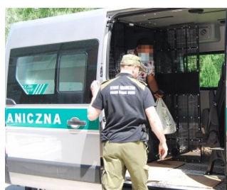
Tunezyjczyk zatrzymany w powiecie buskim

Wobec cudzoziemca Komendant Placówki SG w Kielcach wszczął postępowanie administracyjne o zobowiązaniu do powrotu. Dodatkowo zastosowano wobec obywatela Tunezji środki alternatywne, w postaci zgłaszania się w drugi poniedziałek miesiąca do Placówki SG w Kielcach oraz zamieszkania w miejscu wyznaczonym, które zostało określone w przedmiotowym postanowieniu.