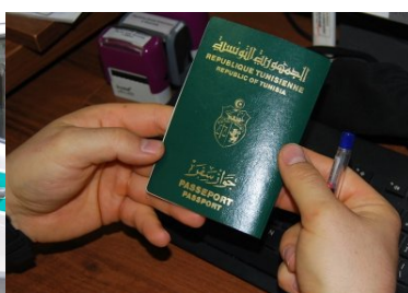
Tunezyjczyk zatrzymany w powiecie buskim