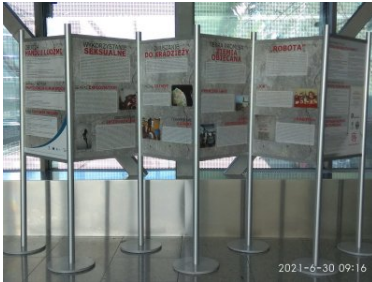
Wystawa „Handel ludźmi” na terenie Portu Lotniczego Kraków Airport