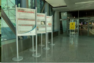
Wystawa „Handel ludźmi” na terenie Portu Lotniczego Kraków Airport