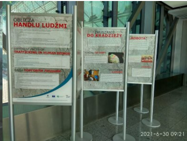
Wystawa „Handel ludźmi” na terenie Portu Lotniczego Kraków Airport