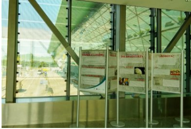
Wystawa „Handel ludźmi” na terenie Portu Lotniczego Kraków Airport