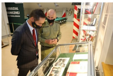
Wizyta przedstawicieli Międzynarodowego Stowarzyszenia Policji - IPA