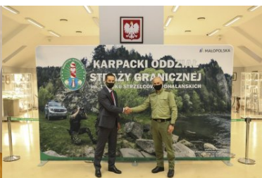
Wizyta przedstawicieli Międzynarodowego Stowarzyszenia Policji - IPA