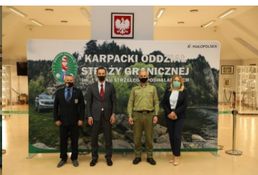
Wizyta przedstawicieli Międzynarodowego Stowarzyszenia Policji - IPA