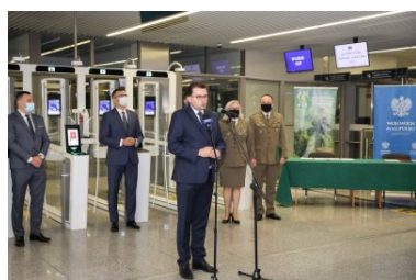
System „Bramek ABC” (Automated Border Control) od dziś na podkrakowskim lotnisku

Kraków Airport staje się z każdym rokiem nowocześniejszy i bardziej przyjazny pasażerom. To obecnie port lotniczy na miarę XXI wieku. Od 5 października funkcjonuje w nim system urządzeń do automatycznej kontroli granicznej podróżnych tzw. „Bramek ABC”, przekazanych do użytkowania przez Wojewodę Małopolskiego Pana Łukasza Kmitę tutejszej Placówce Straży Granicznej.