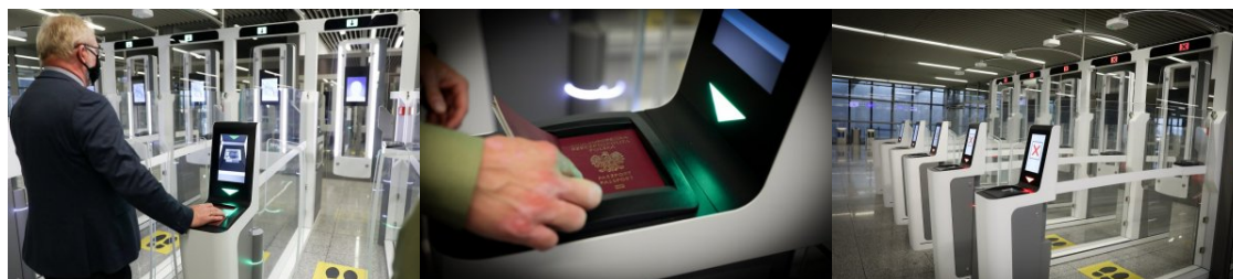
System „Bramek ABC” (Automated Border Control) od dziś na podkarpackim lotnisku