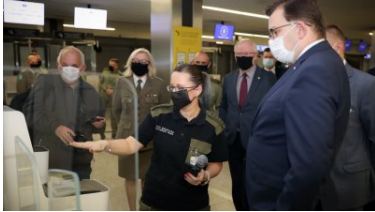
System „Bramek ABC” (Automated Border Control) od dziś na podkrakowskim lotnisku

Nowa inwestycja, pozwala usprawnić proces kontroli granicznej podróżnych, wspomagając funkcjonariuszy Straży Granicznej, pełniących służbę w MPL w Krakowie-Balicach w jeszcze efektywniejszej ochronie granicy państwowej.