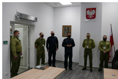
Wspólne szkolenie służb

Spotkanie strażników granicznych z funkcjonariuszami Policji było okazją do wymiany doświadczeń związanych z przedstawianymi podczas szkolenia zagadnieniami. Organizacja i koordynacja wspólnych przedsięwzięć, z pewnością wpłynie na jakość realizacji zadań oraz doskonalenie codziennej współpracy pomiędzy służbami.