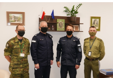
Wspólne szkolenie służb