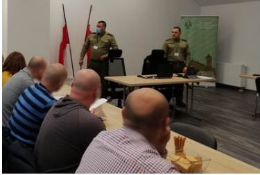
Wspólne szkolenie służb