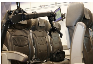
Specjalistyczny sprzęt trafił do PSG w Krakowie-Balicach