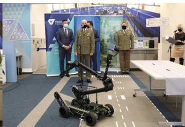
Specjalistyczny sprzęt trafił do PSG w Krakowie-Balicach