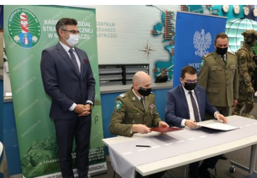
Specjalistyczny sprzęt trafił do PSG w Krakowie-Balicach