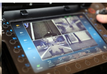
Specjalistyczny sprzęt trafił do PSG w Krakowie-Balicach