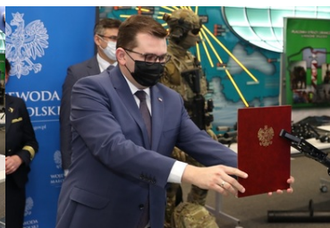
Specjalistyczny sprzęt trafił do PSG w Krakowie-Balicach