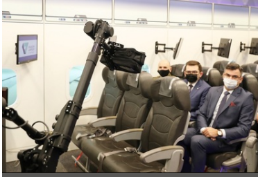
Specjalistyczny sprzęt trafił do PSG w Krakowie-Balicach