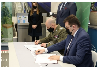
Specjalistyczny sprzęt trafił do PSG w Krakowie-Balicach