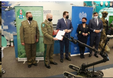
Specjalistyczny sprzęt trafił do PSG w Krakowie-Balicach