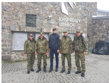
Wizyta Oficera Łącznikowego Policji Republiki Federalnej Niemiec