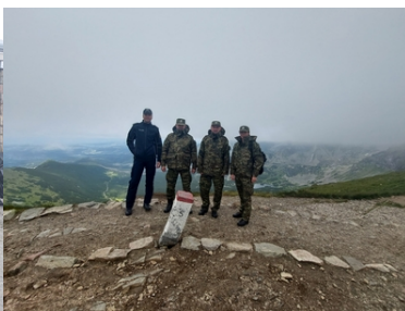
Wizyta Oficera Łącznikowego Policji Republiki Federalnej Niemiec