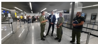
Wizyta Oficera Łącznikowego Policji Republiki Federalnej Niemiec

Natomiast ostatniego dnia wizyty Oficer Łącznikowy Policji RFN przyglądał się służbie funkcjonariuszy SG z krakowskiego lotniska. Podczas prezentacji omówione zostały zadania i struktura Placówki Straży Granicznej w Krakowie-Balicach. Szczególną uwagę zwrócono na problematykę nielegalnej migracji z kierunku greckiego, fałszerstwa dokumentów oraz kwestie związane z bezpieczeństwem pasażerów i portu lotniczego. Na zakończenie wizyty gość z Niemiec obserwował proces odprawy z wykorzystaniem bramek ABC, zapoznał się ze sprzętem na drugiej linii kontroli oraz zadaniami realizowanymi w porcie lotniczym przez funkcjonariuszy Grupy Bezpieczeństwa Lotów.