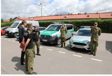
Wizyta Oficera Łącznikowego Policji Republiki Federalnej Niemiec