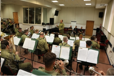
Wizyta Oficera Łącznikowego Policji Republiki Federalnej Niemiec

W kolejnych dniach gość z Niemiec wizytował Placówki KaOSG oraz Centrum Współpracy Policyjnej i Celnej w Trstanie.