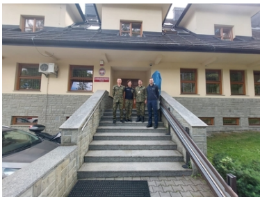
Wizyta Oficera Łącznikowego Policji Republiki Federalnej Niemiec

Wczoraj podczas spotkania w stolicy Podhala - Komendant Placówki SG w Zakopanem omówił realizowane przez funkcjonariuszy PSG zadania. Po części teoretycznej udano się w teren, celem zapoznania gościa z przebiegiem jednego z górskich odcinków granicy państwowej, pozostającego w terytorialnym zasięgu działania Placówki.