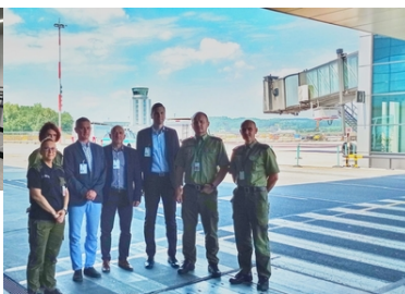
Wizyta Oficera Łącznikowego Policji Republiki Federalnej Niemiec