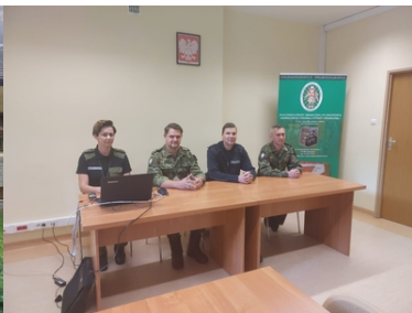
Wizyta Oficera Łącznikowego Policji Republiki Federalnej Niemiec