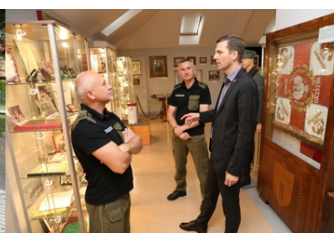
Wizyta Oficera Łącznikowego Policji Republiki Federalnej Niemiec

W trakcie pobytu w Komendzie Oddziału goście zaprezentowano sprzęt wykorzystywany w codziennej służbie oraz zadania z jakimi mierzą się poszczególne komórki organizacyjne KaOSG.