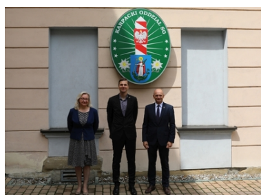
Wizyta Oficera Łącznikowego Policji Republiki Federalnej Niemiec

W pierwszym dniu wizyty gość z Niemiec odwiedził siedzibę Karpackiego Oddziału SG w Nowym Sączu. Przedstawiciel Policji Republiki Federalnej Niemiec miał okazję zapoznać się z historią, strukturą organizacyjną, zasięgiem terytorialnym oraz zadaniami realizowanymi przez KaOSG.