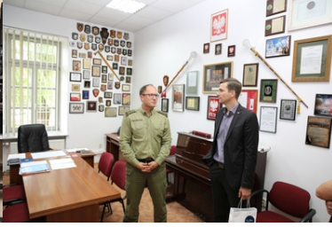
Wizyta Oficera Łącznikowego Policji Republiki Federalnej Niemiec