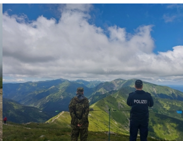
Wizyta Oficera Łącznikowego Policji Republiki Federalnej Niemiec

Natomiast ostatniego dnia wizyty Oficer Łącznikowy Policji RFN przyglądał się służbie funkcjonariuszy SG z krakowskiego lotniska. Podczas prezentacji omówione zostały zadania i struktura Placówki Straży Granicznej w Krakowie-Balicach. Szczególną uwagę zwrócono na problematykę nielegalnej migracji z kierunku greckiego, fałszerstwa dokumentów oraz kwestie związane z bezpieczeństwem pasażerów i portu lotniczego. Na zakończenie wizyty gość z Niemiec obserwował proces odprawy z wykorzystaniem bramek ABC, zapoznał się ze sprzętem na drugiej linii kontroli oraz zadaniami realizowanymi w porcie lotniczym przez funkcjonariuszy Grupy Bezpieczeństwa Lotów.