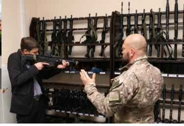
Wizyta Oficera Łącznikowego Policji Republiki Federalnej Niemiec