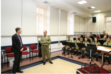
Wizyta Oficera Łącznikowego Policji Republiki Federalnej Niemiec