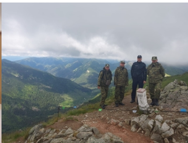
Wizyta Oficera Łącznikowego Policji Republiki Federalnej Niemiec