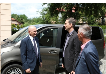
Wizyta Oficera Łącznikowego Policji Republiki Federalnej Niemiec