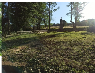
Kolejne nekropolie odzyskują swój blask

Podczas bieżącej akcji prace porządkowe objęły teren 9 nekropolii: nr 43 w Radocynie, nr 45 w Lipnej, nr 47 w Koniecznej, nr 52 w Zduni, nr 58 w Przysłupie, nr 61 w Wirchnym, nr 62 w Banicy, nr 66 w Małastowie oraz nr 77 w Ropicy Górnej.