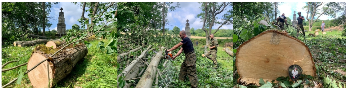
Kolejne nekropolie odzyskują swój blask