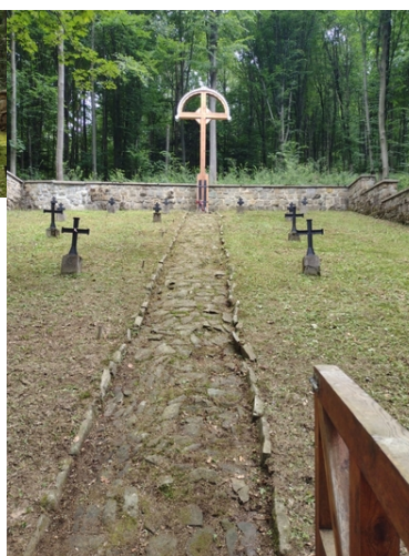
Kolejne nekropolie odzyskują swój blask

Jednak największego nakładu sił wymagał cmentarz wojenny nr 43 w Radocynie. Kontynuowana była w tym miejscu wycinka sporej ilości drzew oraz przeprowadzone zostały prace przygotowujące do odtworzenia ogrodzenia - wszystko zgodnie z