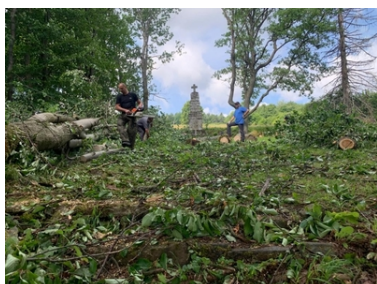
Kolejne nekropolie odzyskują swój blask