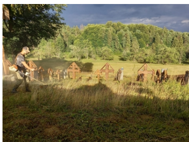
Kolejne nekropolie odzyskują swój blask