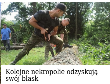
Kolejne nekropolie odzyskują swój blask