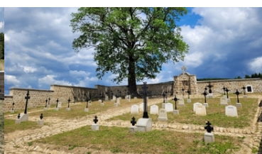
Kolejne nekropolie odzyskują swój blask