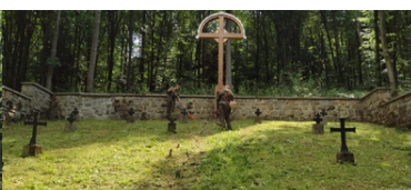
Kolejne nekropolie odzyskują swój blask