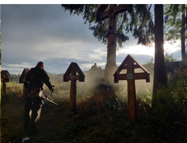
Kolejne nekropolie odzyskują swój blask