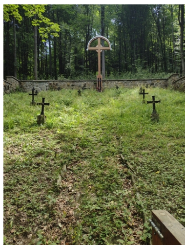
Kolejne nekropolie odzyskują swój blask

Tradycyjnie przywracanie blasku miejscom pamięci, funkcjonariusze SG rozpoczęli od prac na cmentarzu wojennym nr 66 w Małastowie. To nad tą nekropolią od 2016 r. patronat sprawuje Komendant Karpackiego Oddziału Straży Granicznej w Nowym Sączu.