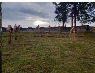
Kolejne nekropolie odzyskują swój blask