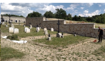
Kolejne nekropolie odzyskują swój blask