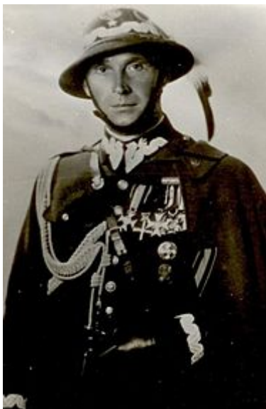
Mieczysław Boruta-Spiechowicz

Generał brygady Mieczysław Ludwik Boruta - Spiechowicz w czasie wojny obronnej Polski w 1939 r. dowodził Grupą Operacyjną „Bielsko” (od 3 września przemianowaną na Grupę Operacyjną „Boruta”) w składzie: 6 Dywizja Piechoty, 21 Dywizja Piechoty Górskiej, 1 Brygada Górską, Batalion Obrony Narodowej „Bielsko”, Batalion Obrony Narodowej „Zakopane” i Batalion Obrony Narodowej „Żywiec”, która otrzymała wyjątkowo trudne zadanie osłony kierunku na Kraków od południowego zachodu. Oddziały gen. bryg. Boruty - Spiechowicza miały opóźnić i rozpoznać działające na tym obszarze siły nieprzyjaciela.